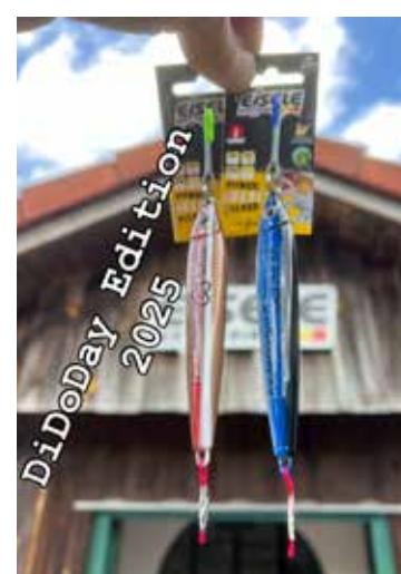
DiDoDay Köder Sammlerstück